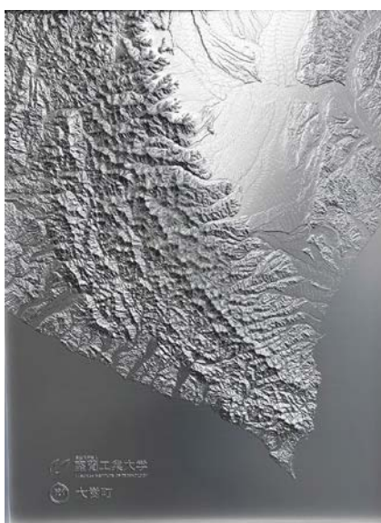
室蘭工業大学特製アルミプレート地図

寄贈した特製のアルミプレート地図は令和4年1月に竣工した大樹町役場新庁舎の応接室に飾られています。