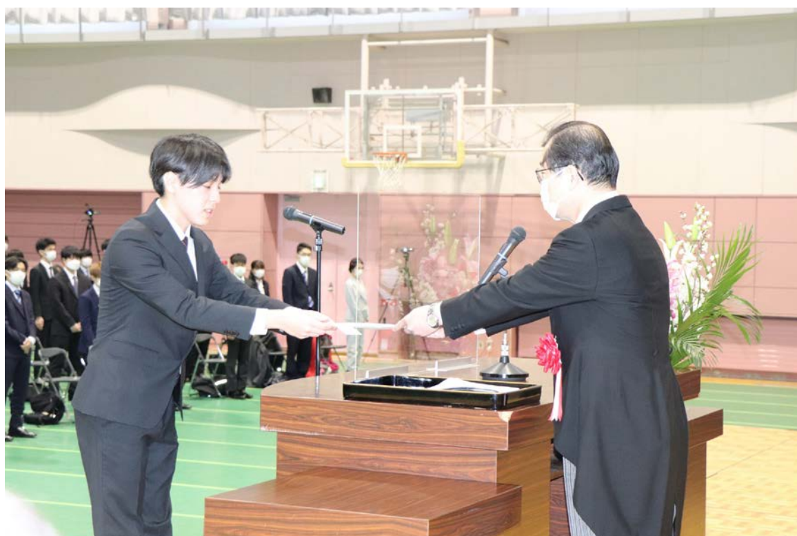
入学宣誓式の様子（3ページに関連記事あり）