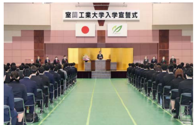
入学宣誓式の様子