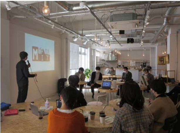
デザインコンペの様子～カフェ「TENTO」

イメージラベルは、山崎ワイナリーのワインや教職員、三笠市職員などの名刺などで活用する予定となっています。