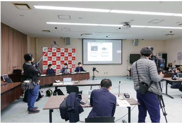
成果報告会の様子