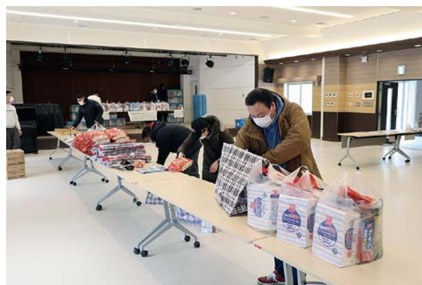
受け取った食料を袋に入れる学生