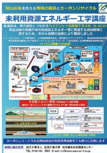
ビジネスEXPO:2021北海道 技術・ビジネス交流会出展ポスター