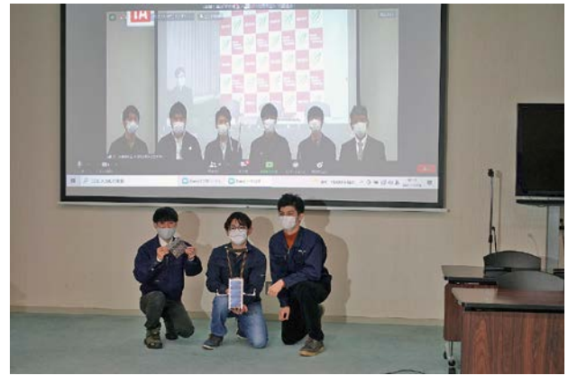
大阪府立大学とオンライン記念撮影