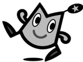
室蘭工業大学のキャラクター「ムロびよん」

■編集発行 室蘭工業大学総務広報課 〒050-8585 室蘭市水元町27番1号 電話 0143-46-5014 ■印刷所 株式会社日光印刷 電話 0143-47-8308