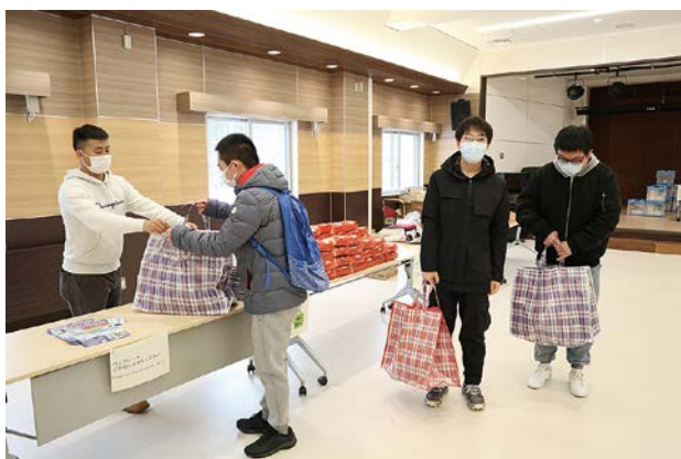
食料を受け取る様子

事前に行ったアンケートでは、「支援に心から感謝します。」「これからも継続してほしい。」などの回答がありました。