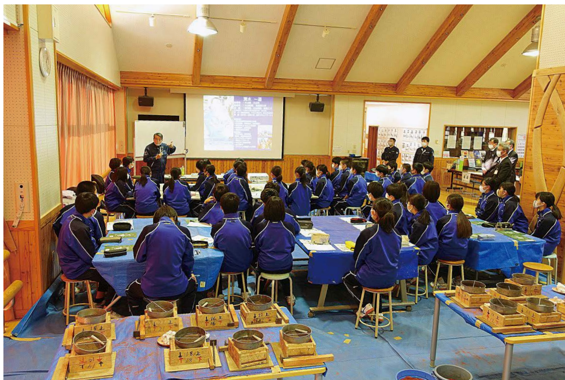
インフォメーションキャラバンin大樹町 大樹中学校 (2ページに関連記事あり)