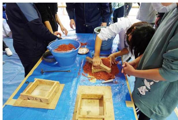
ものづくり体験～大樹小学校