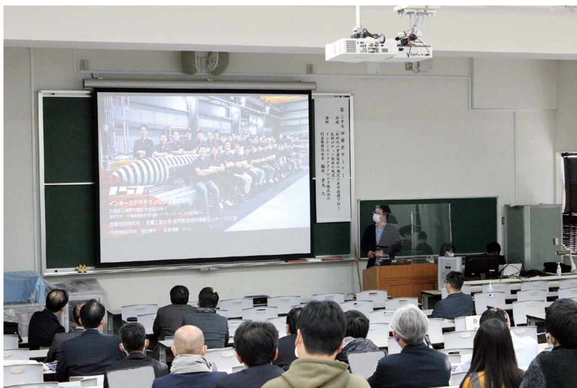
第27回蘭岳セミナーの様子（6ページに関連記事あり）