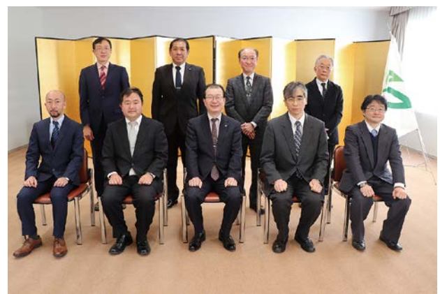
学長とともに記念撮影