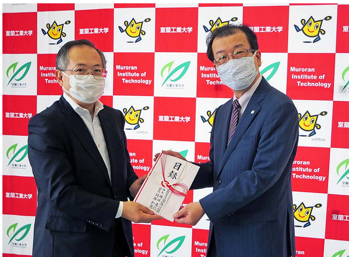
目録贈呈式の様子（1ページに関連記事あり）