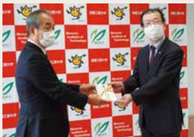
12月2日 東海建設株式会社(2回目の御寄附)

新型コロナウイルス感染拡大の影響により、保護者の家計急変、アルバイトの継続困難など、今後の学生生活に不安を抱える学生を経済的に支援する必要性が高まっています。こうした状況の中、複数の企業や団体様から多大なる御寄附を賜りました。多くの学生の支援に役立てて欲しい、との希望をいただいております。