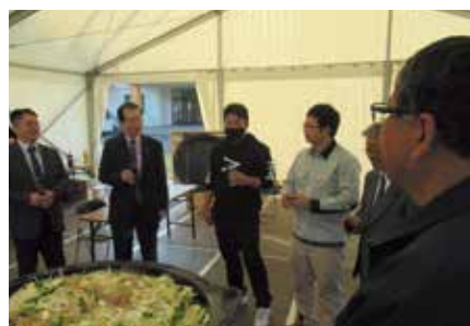
ジンギスカン鍋を囲んでの意見交換