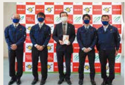
12月18日 陣上グループ(学生へのマスクを御寄附)