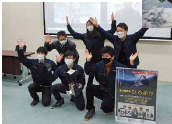
リモート参加者と記念撮影