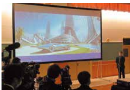
近未来社会の説明