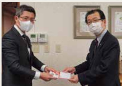
12月2日 室蘭工業大学建設工学科同窓生創の会