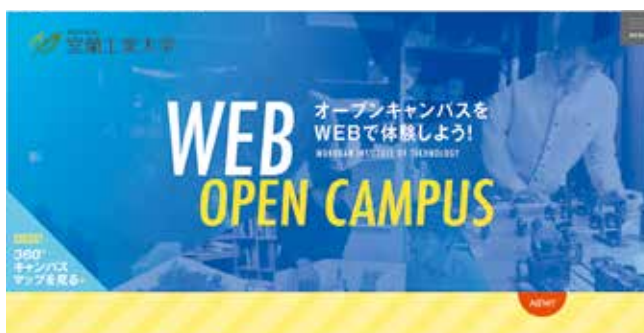
オープンキャンパスWebサイト

https://www.muroran-it-web-opencampus.jp/