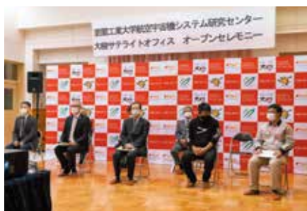
オープンセレモニーの様子

その後、本学名物巨大ジンギスカン鍋で調理した地元産の食材に舌鼓を打ちながら、大樹町を始めとした関係機関と今後の連携等について意見交換を行い、盛会のうちに終わることができました。