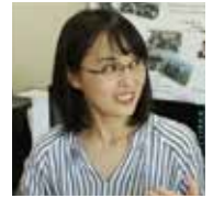
太田 香 准教授

太田香准教授(文部科学省 卓越研究員)がこれまでの顕著な業績が認められ、若手女性研究者の中で極めて優秀な10名を選定し発表するN 2 Women:Rising Stars in Computer Networking and Communications 2020に日本人女性として初めて選定されました。N 2 Womenは、IEEEやACMなど複数の学会がスポンサーとなっている情報ネットワーク/情報通信を研究領域とする研究者からなる団体です。