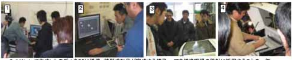
SolidWorksで作成したモデルをRPCに送信、鋳造成形品が完成する様子。ITを鋳造現場の設計に活用することの一例。(北海道工業試験場における実習にて)

実践的教育カリキュラムを開発するために、実証講義、インターンシップを実施しました。