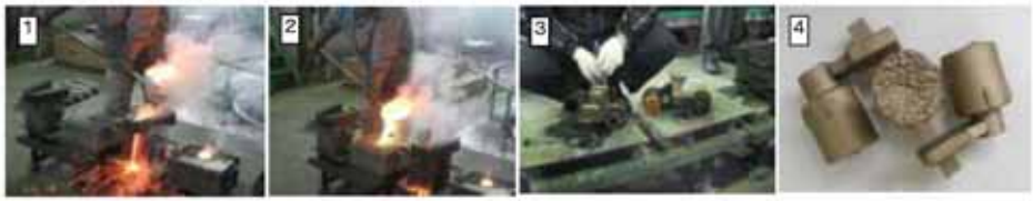
通常の鋳造と凍結鋳造の両方に注湯、鋳型をばらし比較検討している様子。凍結鋳造の特性、品質を実体験で理解することとなる。(㈱光合金製作所と室蘭工業大学によるインターンシップの様子)