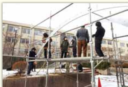
作業をする学生達