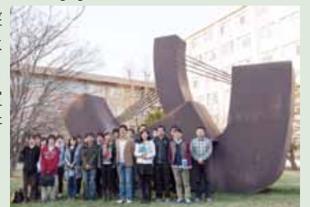
図2. 研究室メンバー

以上のように、本研究室（図2）では IoT 社会実現のため、ネットワークの基盤技術からアプリ等の応用技術まで幅広く研究を行っています。得られた研究成果は世界的に影響のある国際学会や国際論文誌での発表を目標とし、学術的貢献はもちろんのこと、実社会に役立つ技術の創出を目指して取り組んでいます。本研究室の理念として「自由・自主・自立」を掲げ、所属する学生諸君には自由な発想で研究できる環境を提供することで、大きなブレイクスルーに期待を寄せています。