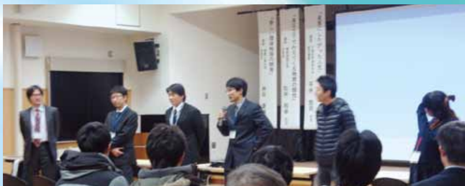
意見交換・交流会の様子